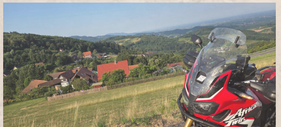
Ausblick von Sasbachwalden ins Rheintal

Die Einwohner von Bühlertal blickten respektvoll auf die Ankömmlinge. Manche schlossen ihre Fensterläden, andere ihre Biergärten. Nicht aus Furcht, sondern aus Ehrfurcht vor einer Macht, die nur einmal im Jahr über ihr Land hereinbrach.