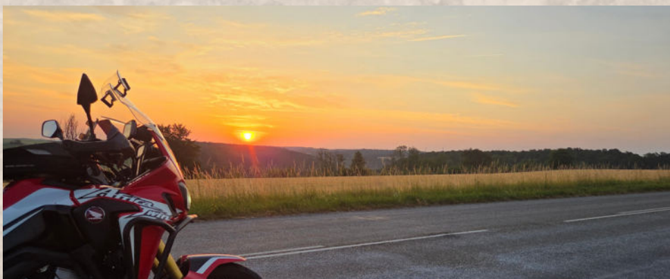
Früh am Morgen begann das Abenteuer

Im Juni des Jahres 2026, - als selbst die Eidechsen den Schatten suchten und die Quellen des Landes versiegten, versammelten sich die echten Helden des Stammes des True Adventure Forums in Bühlertal. Gelegen im Tal des rauschenden Sandbach.