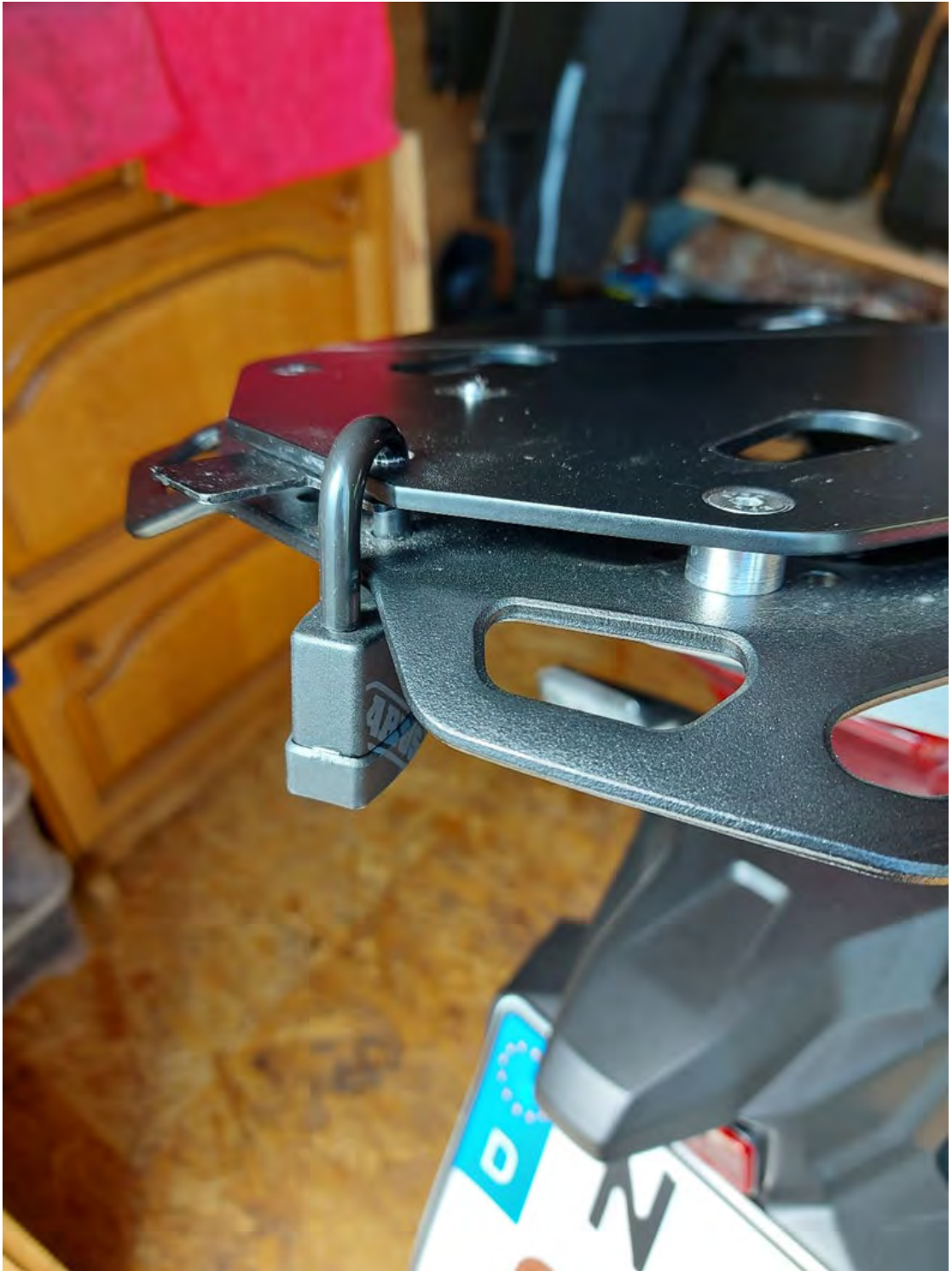
Schloss (Bügel gummiert)