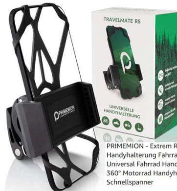
PRIMEMION - Extrem Robuste Handyhalterung Fahrrad & Motorrad Universal Fahrrad Handyhalterung | 360° Motorrad Handyhalterung mit Schnellspanner

Ich kann aus persönlicher Erfahrung sprechen, dass sowohl Handy als auch Halterung perfekt für die Navigation funktionieren.