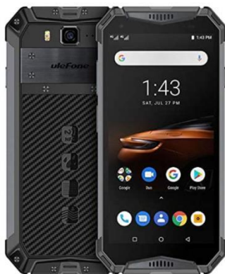
Ulefone Armor 3W - (2019) Outdoor Smartphone ohne Vertrag mit 10300 mAh Akku, Helio P70 6GB + 64GB, 21MP + 8MP Kamera, 5,7 Zoll FHD + Android 9.0 Handy, DUAL SIM/NFC/GPS/Drahtlose Ladung Schwarz

Verwendet werden folgendes Handy und Handyhalterung.