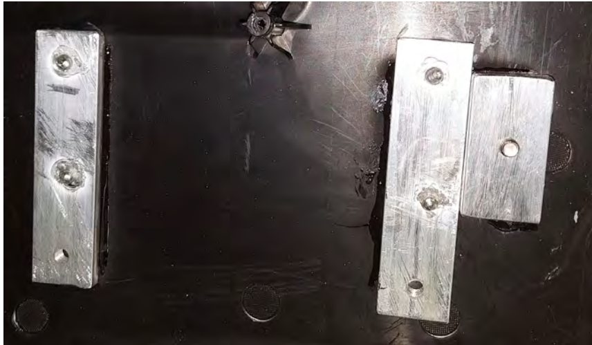
Aluverstärkung eingebracht, verklebt anschließend für die Optik schwarz lackiert.